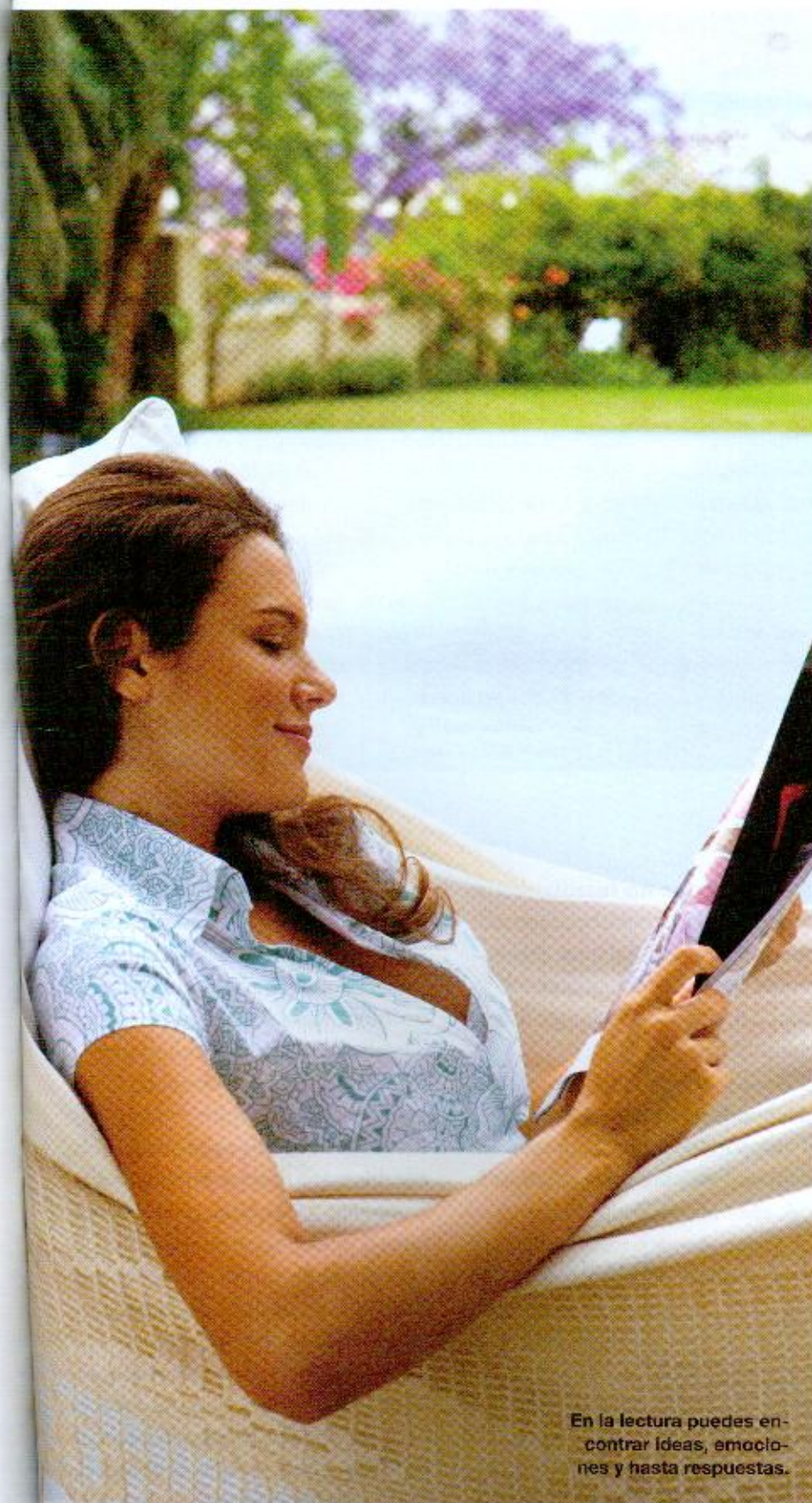
En la lectura puedes encontrar ideas, emociones y hasta respuestas.

Hay que plantearse el diario como un reto, como una oportunidad de aprender, de crecer, de mirar, de escuchar. Como un espejo y un trampolín, como una ayuda de cámara al que