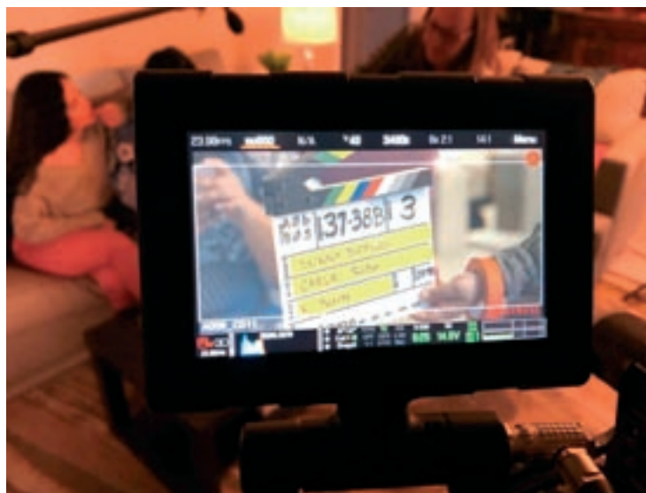
A principis del 2020 va dirigir 'Skinny Dipping', no escrit per ella